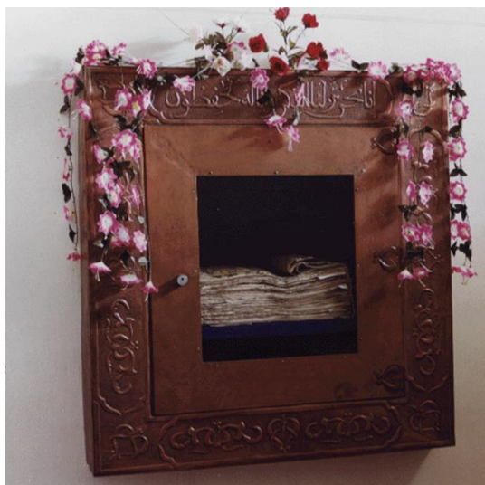
Figura 2 O Sagrado Alcorão de Uthman na sua vitrine de vidro.

(2) O manuscrito do Museu do Palácio Topkapi. [5]