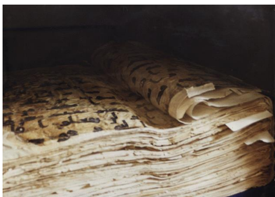
Figura 1 Este manuscrito, guardado pela Organização Islâmica de Usbequistão, é a versão escrita do Alcorão mais antiga que existe. É a versão completa, conhecida como o Mushaf de Uthman, superando todas as outras versões.

"Talvez seja o manuscrito Imam (nome dado à cópia que o próprio Uthman mantinha) ou uma das outras cópias feitas na época de Uthman." [4]