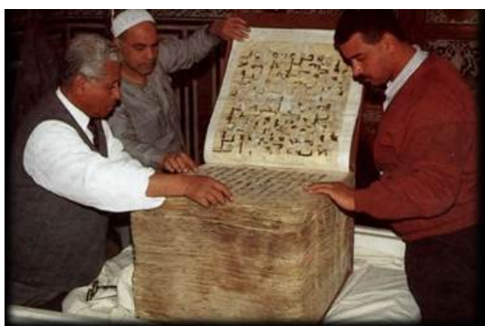
Figura 3 Um manuscrito inicial do Alcorão na Mesquita Al-Hussein, no Cairo, Egito.

(3) O terceiro manuscrito é conservado na Mesquita Al-Hussein, no Cairo, Egito e pode ser visto abaixo.